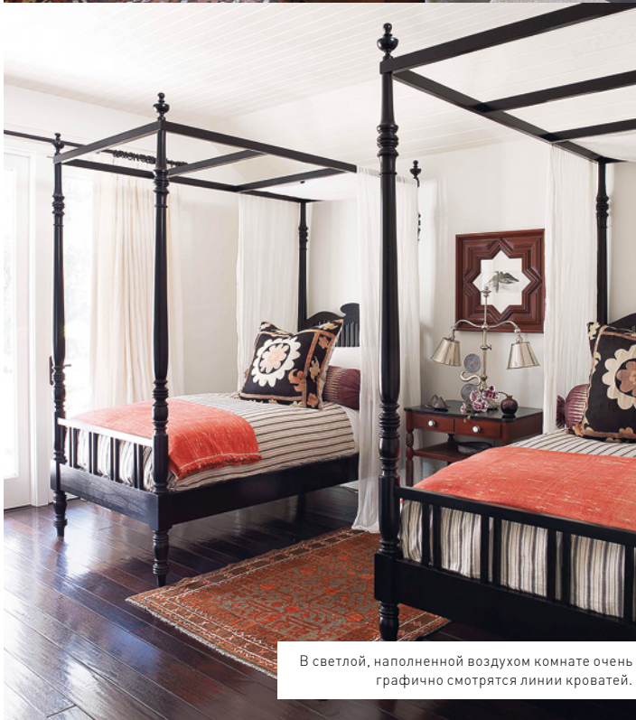
В светлой, наполненной воздухом комнате очень графично смотрятся линии кроватей.