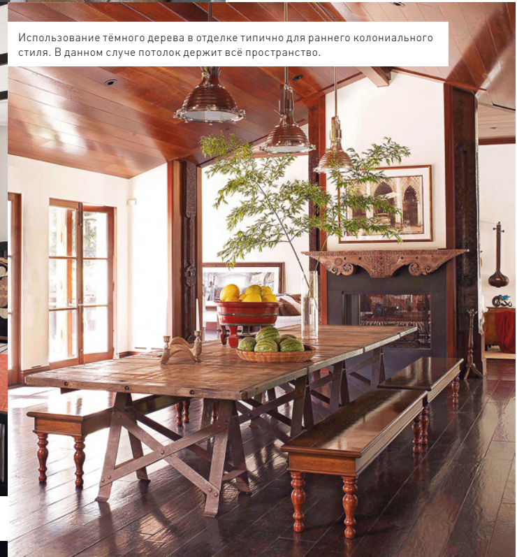
Использование тёмного дерева в отделке типично для раннего колониального стиля. В данном случае потолок держит всё пространство.